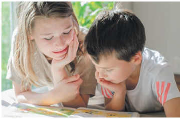
Lesen und Vorlesen bildet gleichermaßen.