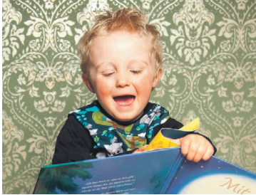
Früh übt sich , was ein Bücherheld werden will.