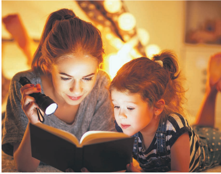
Das Abenteuer beginnt ... Wer liest oder regelmäßig vorgelesen bekommt, erweitert seinen Horizont.