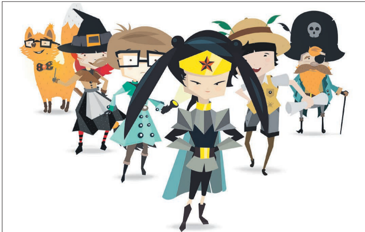
Das sind die sechs Bücherhelden: Fynn, der Fuchs, Conni Clax, Stella Superella, Skadi, Pia Pffiffig und Harry Holzbein